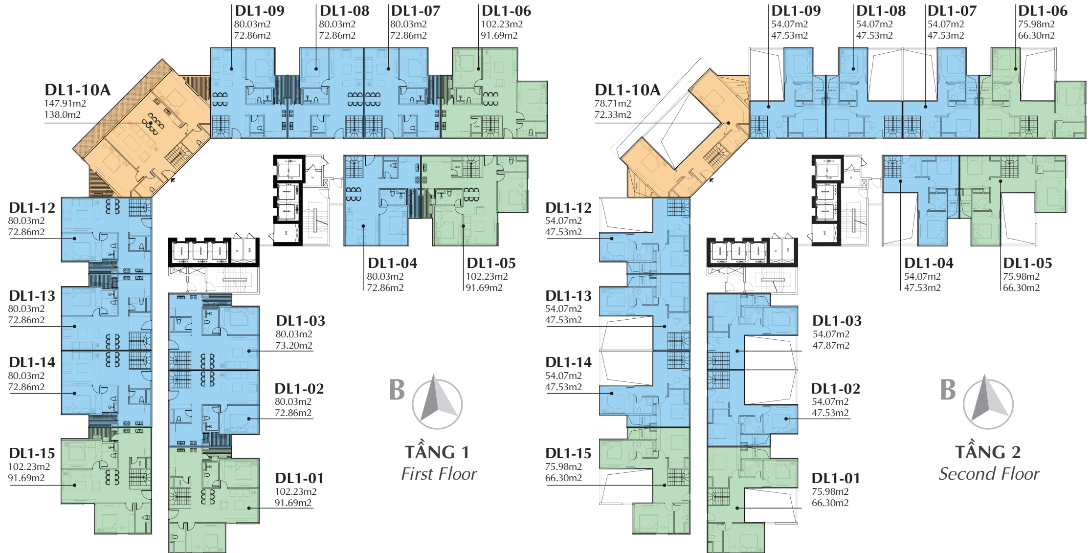
CHI TIẾT MẶT BẰNG ĐIỂN HÌNH TẦNG 30 - 39 Typical plan from 30 - 39