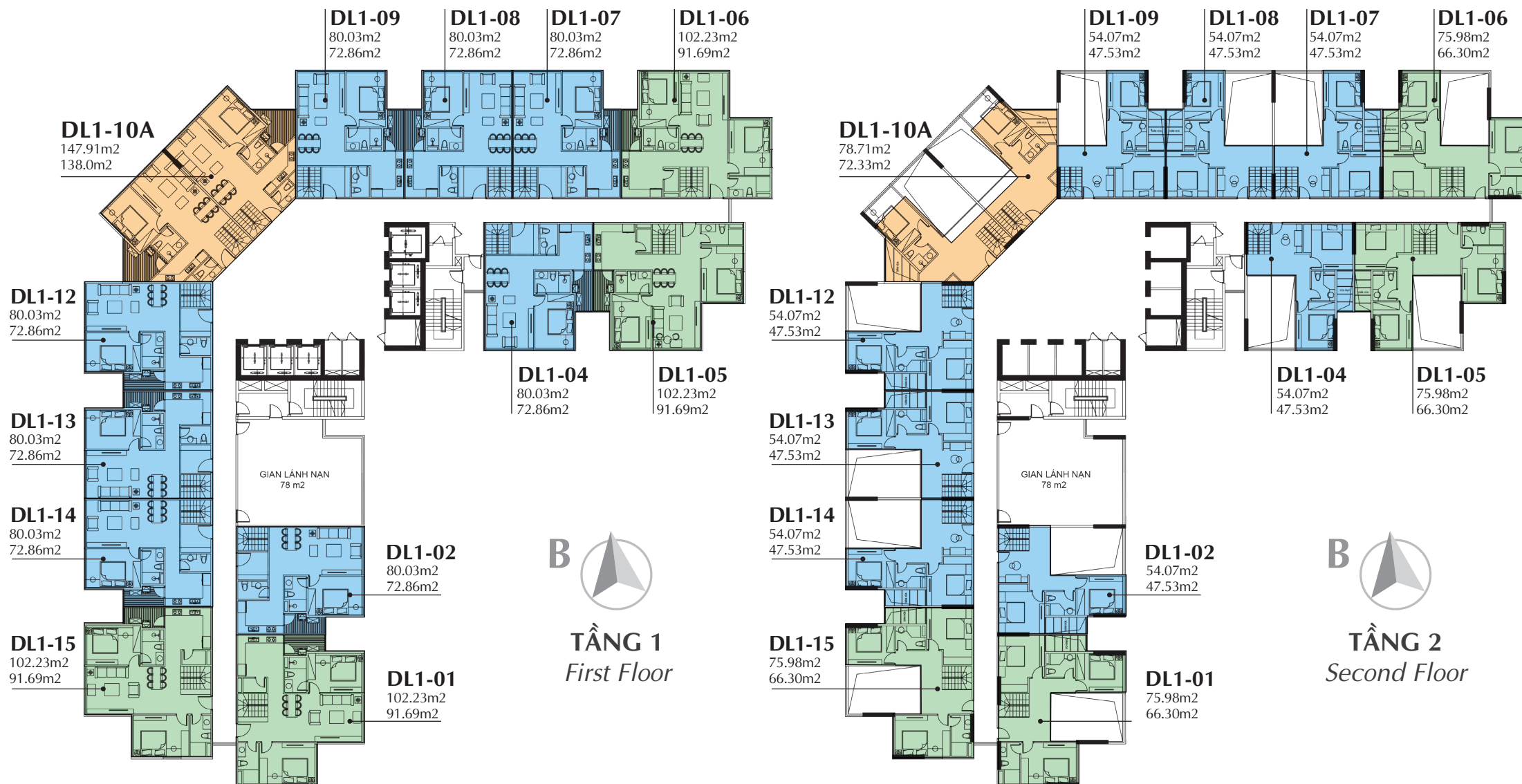
CHI TIẾT MẶT BẰNG ĐIỂN HÌNH TẦNG 20 - 21 Typical plan from 20 - 21